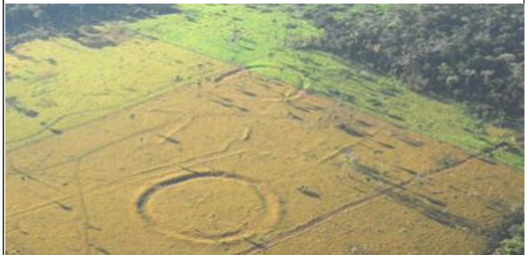
Algunos de los 'Stonehenge' encontrados en el Amazonas (Universidad de Sao Paulo) Más

Además de los círculos encontrados, hace más de 25 años que se descubrió en el Amazonas el Rego Grande, un círculo megalítico compuesto por enormes bloques de granito y que no fue estudiado hasta 2005. Este hallazgo, que coincide con Stonehenge por la presencia de piedras, fue el primero que llevo a los científicos a pensar que el ser humano ocupó este lugar tan arisco para la vida de los hombres y las mujeres.