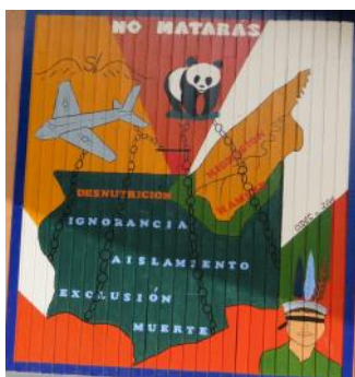
15 SAN BERNARDO

Aquí el área religiosa desde el arte realizada por los Colegios Secundarios de la Provincia Con el respectivo aprecio del JURADO 2016, en relación con el tema y la canción.