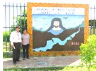
11.27 PUERTO ESPERANZA