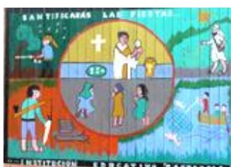
11,67 SANTA MRGARITA