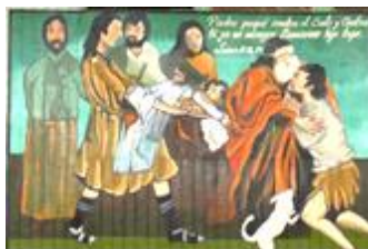
12.18 NUEVA ESPERANZA