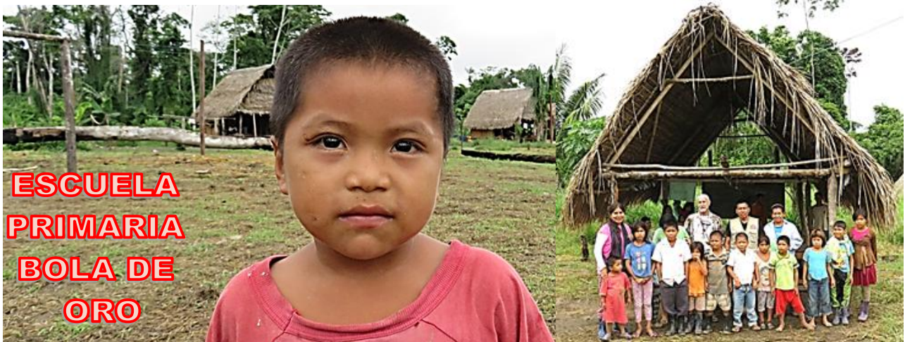
ESCUELA PRIMARIA BOLA DE ORO