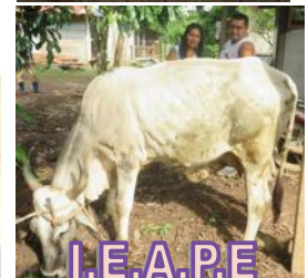
I.E.A.P.E PUERTO ESPERANZA