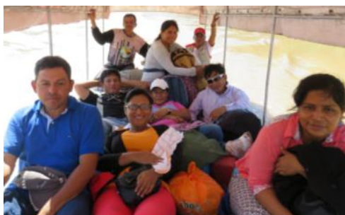
Equipo de ODEC PURUS 2016