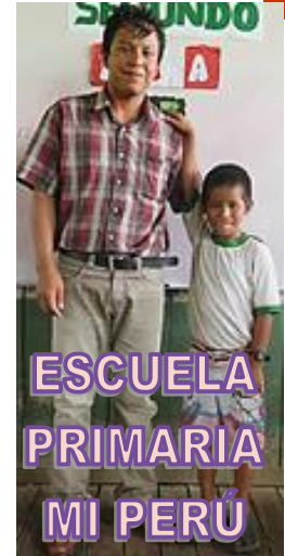
ESCUELA PRIMARIA MI PERÚ