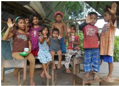
AGUAJAL TRES BOLAS