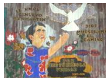
5.83 SAN MARTIN DE PORRES